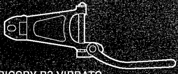
BIGSBY B3 VIBRATO