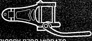
BIGSBY B700 VIBRATO