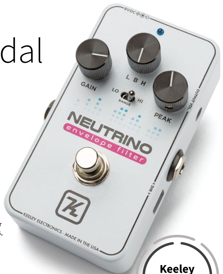
Keeley Neutrino V2

Dazwischen steht „B“, der Bandpassfilter, der beide Enden absenkt, die Mitten verstärkt und dabei in Sachen Frequenz am ehesten wie ein konventionelles Wah agiert. Feinjustiert wird der Grund-Sound über den Range-Schalter, der die Center-Frequenz zwischen Hi und Lo wählt und damit die oberen oder unteren Register des Instruments betont. Das dritte Poti im Bunde ist mit Peak bezeichnet und kontrolliert die Filter-Frequenz – oder anschaulicher formuliert: die Stärke und Schärfe des Effekts. Je weiter es aufgedreht ist, desto intensiver tönt das Wah. In der ersten Hälfte des Regelwegs blendet es sich dezent ins Geschehen ein, bei Rechtsanschlag wird das Signal dann extrem verbogen. Mit diesem flexiblen Konzept lässt das Neutrino zahlreiche Abstufungen zu, die von sanfter Sound-Variation bis zur fast völligen Entfremdung reichen.