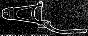
BIGSBY B3® VIBRATO