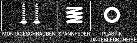
MONTAGESCHRAUBEN SPÄNNFEDER PLASTIK-UNTERLEGSCHIBE